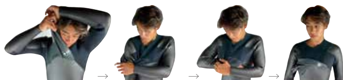
①フラップの横から頭を抜く → ②片腕を抜いてフラップを脇の下へおろす。