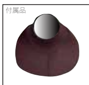
付属品 インナーネックビブ ウェットスーツ内への水の侵入を最小限に防ぎます。

カラー フラップ:Mブラック 両袖:スキン マーク 胸:SC 背中:C2M シルバー 尻:C1M シルバー