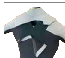
オープンフラップジップ(オプション) 4,000円(税込 4,400円) フラップが開き着脱がし易くなります。着脱を優先したいユーザーへお勧めです。

Scald typeの袖は表側にリペルスキンを使用しているため、脱ぐ時にスキンドウシの引っ掛かりがなくスムーズに袖を抜く事が出来ます。